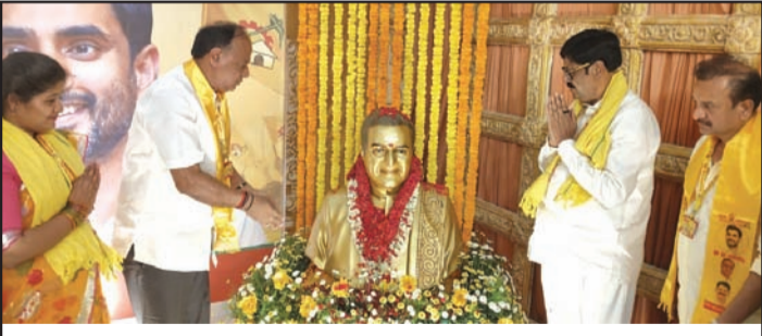
అత్యుత్సాహంతో ఆనం రామనారాయణరెడ్డి సారధ్యంలో...

పార్టీ శ్రేణులు భారీస్థాయిలో పాల్గొనడం సంతోషం కలిగించిందన్నారు. రాష్ట్రాన్ని అభివృద్ధిపథంలో నడిపించేందుకు సీఎం చంద్రబాబు, యువనేత లోకేష్ అవార్ధి