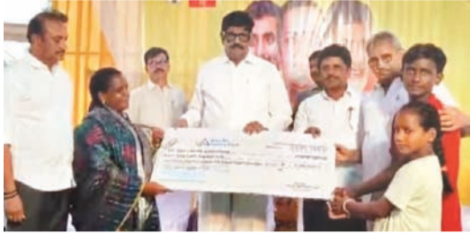
బాధిత కుటుంబానికి చెక్కును పంపిణీ చేస్తున్న మంత్రి ఆనం