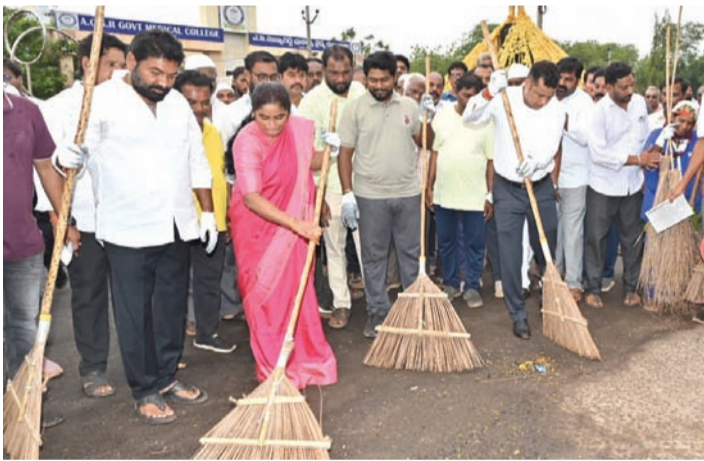
రోడ్డును శుభ్రం చేస్తున్న కలెక్టర్ హిమాన్సు శుక్ల, కమిషనర్ నందన్, మేయర్ సుజాత, కోటంరెడ్డి గిలధర్ రెడ్డి

పరిసరాల పరిశుభ్రత కోసం రాష్ట్ర ప్రభుత్వం చేపట్టిన ఆపరేషన్ క్లీన్ స్వీప్ కార్యక్రమంలో స్వచ్ఛంద సంస్థలు, ప్రజలందరూ భాగస్వామ్యం కావాలని, అప్పుడే మన ప్రాంతాలు పరిశుభ్రమైన వాతావరణం, పచ్చదనంతో కళకళలాడుతాయని జిల్లా కలెక్టర్ హిమాన్సు శుక్లా పిలుపునిచ్చారు. ఇటీవల నెల్లూరులోని ఏసీ సుబ్బారెడ్డి స్టేడియంలో నిర్వహించిన 'ఆపరేషన్ క్లీన్ స్వీప్' ప్రత్యేక పారిశుధ్య కార్యక్రమంలో ఆయన మాట్లాడుతూ, రాష్ట్రంలోని 123 మున్సిపాలిటీలలో మే 22 నుంచి జూన్ 20 వరకు నాలుగు వారాల పాటు ఆపరేషన్ క్లీన్ స్వీప్ కార్యక్రమాన్ని నిర్వహిస్తున్నట్లు తెలిపారు. ప్రతి వారం ప్రత్యేక అంశాలపై దృష్టి సారినూ ప్రధాన రహదారులు, కాలువలు, నాళాలు శుభ్రపరచే పనులు, చెత్త వర్గీకరణ, ప్రజా మరుగుదొడ్ల పరిశుభ్రత వంటి కార్యక్రమాలు చేపడతామని తెలిపారు.