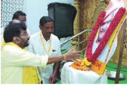
ఎన్టీఆర్ చిత్రపటం వద్ద నివాళులర్పిస్తున్న సోమిరెడ్డి