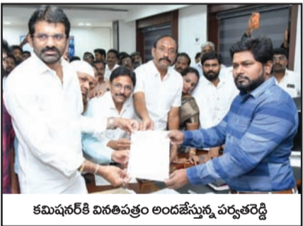
కమిషనరీకి వివరాలను అందించేందుకు పర్వతరెడ్డి

డివిజన్ల పునర్విభజన అంతా అస్తవ్యస్తంగా ఉందని, నగరాభివృద్ధికి విఘాతం కలిగితే పునర్విభజన జరుగుతుందని