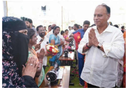
మహిళలకు కుట్టుమిషన్లు పంపిణీ చేస్తున్న విపిఆర్