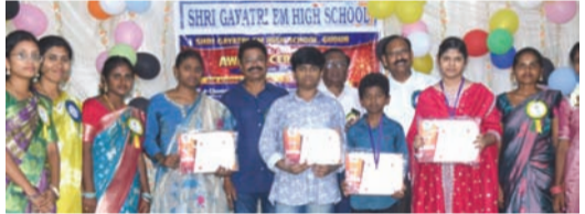
విద్యార్థులని అభినందిస్తున్న స్కూల్ యాజమాన్యం