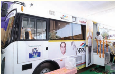
నేత్ర సేవలందిస్తున్న విపిఆర్ నేత్ర-2 బస్సు