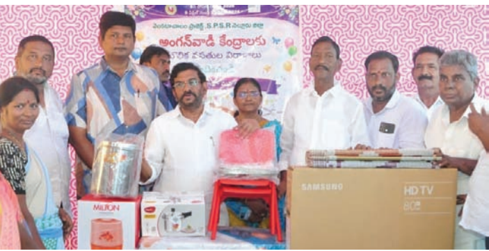
అంగన్వాడీ కేంద్రాలకు పరికరాలను అందజేస్తున్న సోమిరెడ్డి, కృష్ణ ఆయిల్ అండ్ ఫాట్స్ ప్రతినిధులు