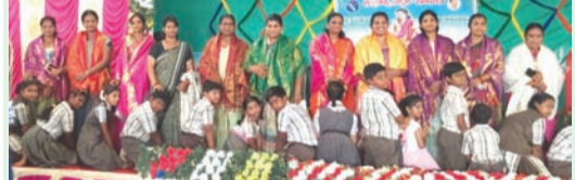
తల్లిలకి పాదపూజ చేస్తున్న విద్యార్థినివిద్యార్థులు