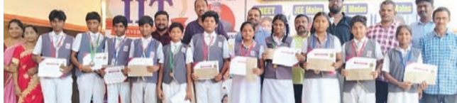
విద్యార్థులకి బహుమతులు, పతకాలు అందజేస్తున్న ముఖ్యఅతిథులు