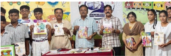
పుస్తకాలను పంపిణీ చేస్తున్న 'అరసం' సభ్యులు