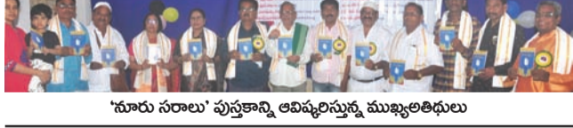
'నూరు సరాలు' పుస్తకాన్ని ఆవిష్కరిస్తున్న ముఖ్యఅతిథులు