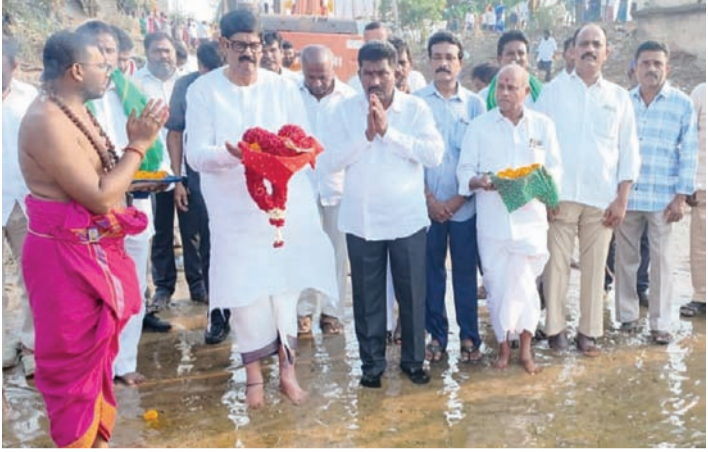
గంగమ్మకు సారెను సమర్పిస్తున్న మంత్రి ఆనం రామనారాయణరెడ్డి

జలాలను పరిరక్షించుకుంటూ, రైతులు పంటపొలాలు సాగు చేసుకోవాలని, జలసిరితోనే ప్రజలకు అసలైన సిరి అని రాష్ట్ర దేవదాయమంత్రి ఆనం రామనారాయణరెడ్డి చెప్పారు. ఈనెల 6న ఆత్మకూరు నియోజకవర్గంలోని సంగం మండలం గాంధీజనసంఘం వద్ద రైతుల ఆనందోత్సాహాల మధ్య ఆయన 'జలసిరి పండుగ' నిర్వహించారు. గంగమ్మ తల్లికి చీర సారె సమర్పించిన ఆనంతరం రూ. 84.75 లక్షలతో కనిగిరి రిజర్వాయర్ మెయిన్ కెనాల్లో పూడికతీత పనులను మంత్రి ప్రారంభించారు. ఈ సందర్భంగా సంఘం బ్యారేజ్ సమీపంలో నిర్వహించిన సభలో మంత్రి ఆనం మాట్లాడుతూ, 'ప్రతి నీటిబొట్టును ఒడిసి పట్టుకుంటాం... రైతన్నకు తోడుగా ఉంటాం' అన్నారు. జల వనరుల సంరక్షణ ప్రధాన లక్ష్యంగా వంద రోజుల ప్రణాళికతో "జలసిరి" కార్యక్రమాన్ని ఆత్మకూరు నియోజకవర్గంలో ప్రారంభించామన్నారు. జిల్లాలో కాలువలు, చెరువుల పూడికతీత, పంట కాలువల అభివృద్ధి వంటి 1979 పనులకు రూ. 62 కోట్లు మంజూరు చేయగా, ఆత్మకూరుకు రూ. 12 కోట్లు కేటాయించామని తెలిపారు. ఈనెల 15వ తేదీ వరకు అవసరమైన పనులను గుర్తించి, 70 రోజుల్లో పూర్తి చేసేలా కార్యాచరణ రూపొందిస్తున్నామని పేర్కొన్నారు. సోమశిల, కండలేరు జలాశయాల్లో నీటిని సమృద్ధిగా నిల్వ ఉంచితే మూడు సంవత్సరాలపాటు సాగు, తాగునీటికి ఎలాంటి ఇబ్బంది ఉండదన్నారు. సోమశిల ఉత్తర, దక్షిణ కాలువల అభివృద్ధికి నిధులు మంజూరుచేసి, ఉత్తర కాలువ ద్వారా రాళ్లపాడు వరకు నీటిని అందిస్తున్నామని తెలిపారు. సంగం బ్యారేజ్ రోడ్డు బ్రిడ్జి నిర్మాణానికి సీఎం గ్రీన్ సిగ్నల్ ఇచ్చినట్లు వెల్లడించారు.