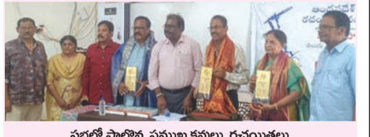
సభలో పాల్గొన్న ప్రముఖ కవులు, రచయితలు