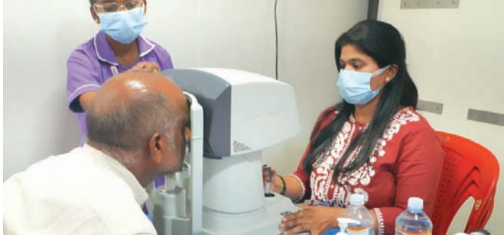
నేత పరీక్షలు చేస్తున్న వైద్యులు