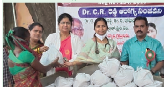
పాష్టికాహారాన్ని పంపిణీ చేస్తున్న వైద్యులు