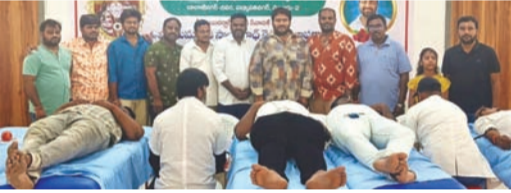
రక్తదానం చేస్తున్న యువకులు