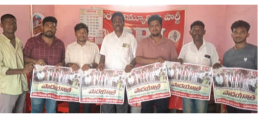
గోడపత్రికలని ఆవిష్కరిస్తున్న వ్యవసాయ కార్మిక సంఘం నాయకులు