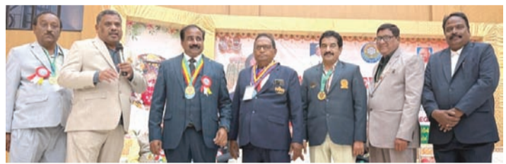
వాకర్స్ ఇంటర్నేషనల్ కౌన్సిల్ మీటింగ్లో పాల్గొన్న నెల్లూరు వాకర్స్ ప్రతినిధులు