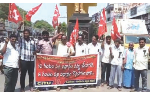
టవర్ క్లాక్ వద్ద నిరసన వ్యక్తం చేస్తున్న సి.ఐ.టి.యు నాయకులు