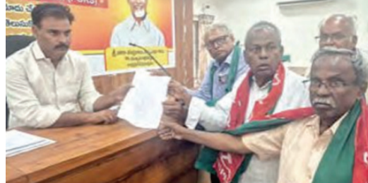
ఆర్థిక వివేకంతో సమర్పిస్తున్న కార్మిక సంఘం నాయకులు