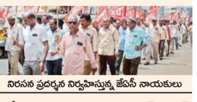
నిరసన ప్రదర్శన నిర్వహిస్తున్న జేపీసీ నాయకులు