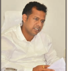
జిల్లా కలెక్టర్ హిమాన్సు శుక్ల

జిల్లాలో తాగునీటి ఎద్దడిని పూర్తిగా నివారించేందుకు 197 తాగునీటి పనులకు రూ. 103.38 కోట్ల నిధులను రాష్ట్ర ప్రభుత్వం మంజూరు చేసిందని జిల్లా కలెక్టర్ హిమాన్సు శుక్ల తెలిపారు. మార్చి 30న జిల్లాలో తీవ్ర తాగునీటి ఎద్దడి నెలకొన్న గ్రామాల్లో నీటి వనరుల పరిస్థితిని అధికారులతో సమీక్షించారు. ఈ సందర్భంగా ఆయన మాట్లాడుతూ, మంచినీటి వనరుల భాగుకు ఉమ్మడి నెల్లూరుజిల్లాలోని అత్యుక్తారు నియోజక వర్గంలో 36 పనులకు 13.43 కోట్లు, గూడూరు నియోజకవర్గంలో 16 పనులకు 7.44కోట్లు ప్రభుత్వం కేటాయించిందన్నారు. అదేవిధంగా, కావలి నియోజకవర్గంలో 2 పనులకు 14.76 కోట్లు, కోవూరులో 34 పనులకు 22.26 కోట్లు, నెల్లూరు రూరల్లో 13 పనులకు 4.11 కోట్లు, సర్వేపల్లి 44 పనులకు 13.26 కోట్లు, ఉదయగిరి 40 పనులకు 23.72 కోట్లు, వెంకటగిరి 12 పనులకు 4.36 కోట్లు మొత్తం 103.38 కోట్లు మంజూరైనట్లు తెలిపారు. ఇంటింటికి కుళాయి కనెక్షన్ ఏర్పాటు, ఓవర్ హెడ్ ట్యాంకుల రిపేర్లు, నూతన ట్యాంకుల నిర్మాణం, నిరుపయోగంగా ఉన్న సమగ్ర గ్రామీణ నీటి పథకాలను పునరుద్ధరించేందుకు చర్యలు చేపట్టనున్నట్లు తెలిపారు.