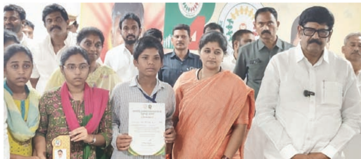
మార్గదర్శులకి ప్రశంసాపత్రాలని అందజేస్తున్న మంత్రి ఆనం రామనారాయణరెడ్డి

జల్ జీవన్ మిషన్ ద్వారా రాష్ట్రానికి కేంద్రం నుంచి నిధులు భారీగా వస్తున్నాయని, రూ. 1814.71 కోట్లతో 3000 పనులను రాష్ట్రానికి కేంద్ర ప్రభుత్వం మంజూరు చేసిందని రాష్ట్ర దేవదాయ మంత్రి ఆనం రామనారాయణరెడ్డి చెప్పారు. అందులో భాగంగా ఆత్మకూరు నియోజకవర్గంలో 36 పనులకు 13.43 కోట్లు మంజూరయ్యాయన్నారు. ఆత్మకూరు మున్సిపాలిటీ కార్యాలయంలో మార్చి 30న పీ4 కార్యక్రమంలో మంత్రి ఆనం రామనారాయణరెడ్డి, వారి తనయ ఆనం లీలా కైవల్యరెడ్డి పాల్గొన్నారు. ఈ సందర్భంగా మంత్రి ఆనం మాట్లాడుతూ, నెల్లూరు జిల్లాకు 197 తాగునీటి పనులకు 103 కోట్లు మంజూరు చేస్తూ రాష్ట్ర ప్రభుత్వం