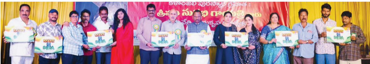
'మేక్ ఇన్ ఇండియా' పోస్టర్నిం పోస్టర్ను ఆవిష్కరిస్తున్న ముఖ్యఅతిథులు