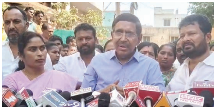
విలేకరులతో మాట్లాడుతున్న మంత్రి నారాయణ, పక్కన మేయర్ సుజాత తదితరులు

తాము నెల్లూరు నగరంలో చెట్లు నాటడం కోసం కార్పొరేషన్ నుంచి ఒక్క పైసా ఖర్చు చేయలేదని, అయితే వాస్తవాల తెలుసుకోకుండా తామేదో కుంభ కోణాలు చేస్తున్నట్లు ఆరోపణలు చేయడం, అవాకులు చవాకులు పేలడం మంచి వద్దని కాదని, అలాంటివాటిని ఇకపై సహించేది లేదని రాష్ట్ర పురపాలక మంత్రి నారాయణ వైసీపీ నాయకులను హెచ్చరించారు. ఇటీవల ఆయన నెల్లూరు 3వ డివిజన్ లో పర్యటించిన సందర్భంగా విలే కర్డతో మాట్లాడుతూ, వైసీపీ నేతలు తమపై చేస్తున్న ఆరోపణలను ఖండించారు. వారిపట్ల అసత్య ఆరోపణలేనని కొట్టిపారేశారు. వేసవిలో ఉష్ణోగ్రతను కనీసం 2 డిగ్రీలైనా తగ్గించాలని ప్రతి 5 మీటర్లకు ఒక చెట్టు నాటాలని తాము సంకల్పించామని, కార్పొరేషన్ నుంచి ఒక్కపైసా కూడా తీసుకోకుండా దాతల నుంచి నిధులు సేకరించి ప్రజల కోసం ఆ అభివృద్ధి పనులు చేస్తున్నామని ఆయన స్పష్టం చేశారు. కేవలం చెట్ల కోసమే ఒక దాత రెండు కోట్ల రూపాయలు విరాళంగా ఇచ్చారని, తన స్నేహితులు ట్రీగార్డ్స్ ఏర్పాటుకు సహకరిస్తున్నారని తెలిపారు. దేశవిదేశాల్లో ఉన్న తన స్నేహితులను సహాయం అడుగుతున్నది తన కోసం కాదని, నెల్లూరు