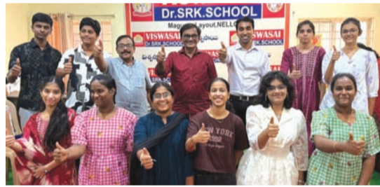
పాఠశాల డైరెక్టర్లతో ఉత్తమ మార్కులు సాధించిన విద్యార్థిని విద్యార్థులు