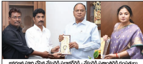
జనగణన పూర్తి చేసిన వేమిరెడ్డి ప్రభాకర్ రెడ్డి - వేమిరెడ్డి ప్రశాంతిరెడ్డి దంపతులు