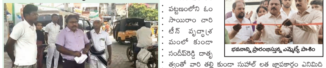
పెట్రోల్ బంకును తనిఖీ చేస్తున్న ఆర్డీవో