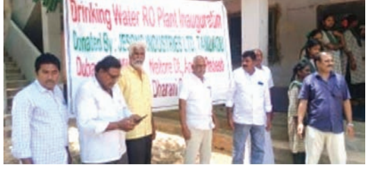
ఆర్.పి.వాలర్ ప్లాంటును ప్రారంభిస్తున్న 'ధరణి' సేవాసమితి ప్రతినిధులు