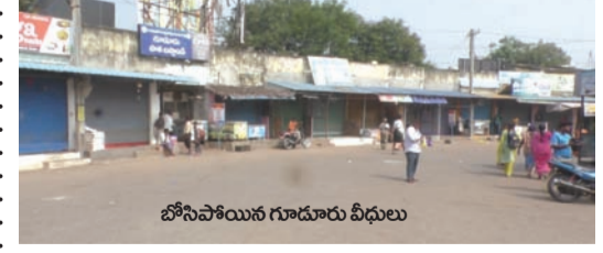
బోసిపోయిన గూడూరు వీధులు

గూడూరును జిల్లా కేంద్రం చేయాలి, లేని పక్షంలో నెల్లూరు జిల్లాలో కలపాలనే డిమాండ్ తో గూడూరు పట్టణంలో జేపీసీ ఆధ్వర్యంలో గత 16 రోజులుగా రిలే దీక్షలు కొనసాగుతున్నాయి. ఈ నేపథ్యంలో జేపీసీ ఆధ్వర్యంలో నిర్వహించిన నియోజకవర్గ బండ్ విజయవంతమైంది. పలువురు వ్యాపారస్తులు స్వచ్ఛందంగా దుకాణాలను మూసి సంఘీభావం తెలియజేశారు. విద్యార్థి జేపీసీ సభ్యులు గూడూరును జిల్లా కేంద్రం చేయాలని నినాదాలతో పట్టణంలో ర్యాలీ నిర్వహించారు. ఎక్కడ అవాంఛనీయ సంఘటనలు జరగకుండా పోలీసు బందోబస్తు ఏర్పాటుచేశారు. జ్యూవెలరీ, బార్ అసోసియేషన్ సభ్యులు బండ్ కు మద్దతు తెలిపారు.