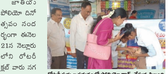
రోటరీ సభ్యుల సమక్షంలో పోలియో డ్రాప్స్ వేస్తున్న సిబ్బంది