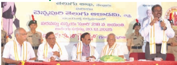
పరవస్తు చిన్నయసూరి 218వ జయంతి సభలో ప్రసంగిస్తున్న వక్రలు