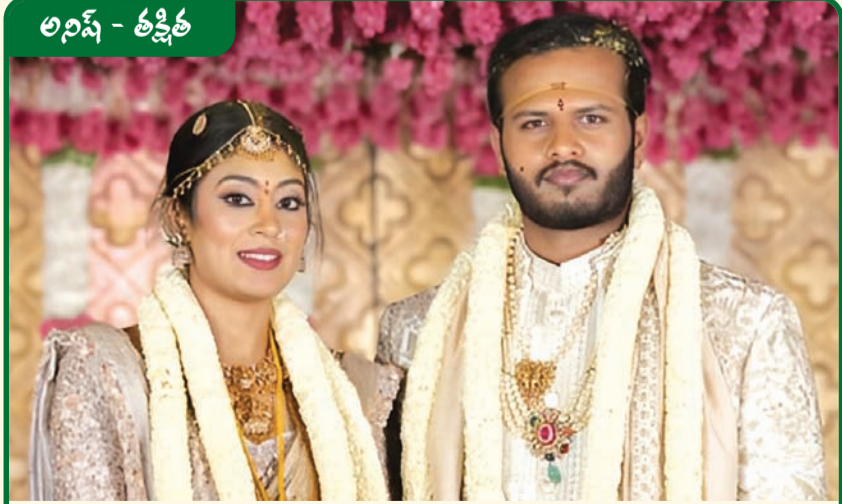
అనిష్ - తక్షిత

కార్తీక పున్నమి సందర్భంగా ఈనెల 5వ తేదీ బుధవారం నాడు ఆలయాల భక్తజనంతో క్రిక్కిరిసి పోయాయి. కార్తీక దీపాలు వెలిగించి పూజలు చేసుకునేందుకు మహిళాభక్తులు వేల సంఖ్యలో ఆలయాలకు తరలివచ్చారు. ఈ సందర్భంగా పెంచలకోనలో శ్రీ లక్ష్మీస్వస్తింహస్వామికి గరుడోత్సవం నిర్వహించారు. నందనవనంలో ఉసిరిచెట్టు వద్ద దీపారాధనలు చేశారు. సహస్రకలశాభిషేకం, హోమాలు చేశారు. సుదర్శన చక్రానికి ప్రత్యేక పూజలు చేశారు. అదేవిధంగా శైవాలయాల్లోనూ విశేష పూజలు, విశిష్ట సేవలు జరిగాయి. జొన్నవాడ కామాక్షి తాయి అమ్మవారి దేవాలయంలో జ్వాలాతోరణం కార్యక్రమాన్ని దేదీప్యమానంగా నిర్వహించారు. సిద్ధేశ్వరకోన వద్ద నదీన్నానాలు ఆచరించి కార్తీకదీపాలు వెలిగించి నదిలో వదిలారు. రామతీర్థంలోని శ్రీ కామాక్షిదేవి సమేత శ్రీ రామలింగేశ్వరాలయం, కోటితీర్థంలోని శ్రీ కోటేశ్వరస్వామి దేవాలయం, కొడవలూరులోని శ్రీ ఉదయకాళేశ్వరాలయం, మైపాడు శివాలయం.. కాటేపల్లి శివాలయం, కృష్ణపట్నంలోని కామాక్షిదేవి సమేత శ్రీ సిద్ధేశ్వరస్వామి దేవాలయం, కాకుటూరులో దుర్గాభవని సమేత శ్రీ అభయ లింగేశ్వరాలయం, కలువాయిలోని శ్రీ నీలకంఠేశ్వరాలయం, కుల్లూరు గంగాధర్మీశ్వరాలయం, భైరవకోన ఇలా అన్ని దేవాలయాల్లో శివకేశవారాధనలు భక్తిశ్రద్ధలతో జరిగాయి. స్థానిక ప్రజలు, ప్రముఖులు అంతా ఆలయాలకు వచ్చి ఆ మహాదేవునికి పూజలు చేసుకున్నారు. నెల్లూరు నగరంలోని శ్రీ మూలస్థానేశ్వరాలయం, శ్రీ రాజరాజేశ్వరదేవి ఆలయం, నవాబుపేట శివాలయం, చెరువు ఒడ్డున ఉన్న గణేశ్ పూజల వద్ద భక్తులు కార్తీక దీపాలు వెలిగించి ఆ పరమేశ్వరునికి ప్రణమిల్లారు.