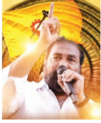
అంశాల గురించి సంబంధిత శాఖల అధికారులు సిబ్బందిని ప్రశ్నించారు. మధ్యతరగతి ప్రజలను లంచాల కోసం