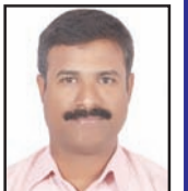
తుమ్మల బాల గంగాధర్ తిలక్

పాలస్తీనాను గుర్తించే దేశాల సంఖ్య కూడా పెరుగుతుండడం ట్రంప్ త్వరగా ఒక శాంతి సూత్రంతో ముందుకు రావడం కారణం. ఐక్యరాజ్యసమితిలోని 193 నభ్యు దేశాలలో, ఇప్పుడు మొత్తం 153 దేశాలు అధికారికంగా పాలస్తీనాను గుర్తించాయి. ముఖ్యంగా యూరోపియన్ దేశాలు పాలస్తీనాను ఒక దేశంగా గుర్తించాయి. ఈ తాజా మార్పు యునైటెడ్ కింగ్ డమ్ తో మొదలయింది. “మధ్యప్రాచ్యంలో పెరుగుతున్న భయానక పరిస్థితుల దృష్ట్యా, శాంతిని నెలకొల్పడానికి రెండు దేశాల ఏర్పాటే పరిష్కారం (Two-state solution) దిశగా చర్యలు తీసుకుంటున్నాము” అని ప్రధాని కీర్ స్పార్కర్ చెప్పారు. ఆ తర్వాత కెనడా, ఆస్ట్రేలియా, పోర్చుగల్ దేశాలు కూడా అదే బాట పట్టాయి. సెప్టెంబర్ 22న, ఫ్రాన్స్ అధ్యక్షుడు ఇమ్మాన్యుయేల్ మాక్రాన్ కూడా ఇదే నిర్ణయాన్ని ప్రకటించారు, అలాగే మాల్డా, మొనాకో, లక్సెంబర్గ్, శాన్ మారిన్ కూడా ఇలాంటి నిర్ణయాలనే ప్రకటించాయి. ఇటీవల ఐరాస సర్వసభ్య సమావేశం సందర్భంగా, సౌదీ అరేబియా, ఫ్రాన్స్ ల సహ-అధ్యక్షతన ‘పాలస్తీనా సమస్యకు శాంతియుత పరిష్కారం, రెండు దేశాల ఏర్పాటు ద్వారా పరిష్కారం అమలు కోసం ఉన్నత-స్థాయి అంతర్జాతీయ సమావేశం’ అనే అంశంపై భేటీ జరిగింది. ఈ సమావేశంలోనే పాలస్తీనాను గుర్తిస్తూ పలు దేశాలు ప్రకటనలు చేశాయి. మొత్తంమీద, ఐరాసలోని 80 శాతం దేశాలు ఇప్పుడు పాలస్తీనాను గుర్తించడంతో ట్రంప్ చొరవ తీసుకోక తప్పింది కాదు. పైగా ఆయన నోబెల్ శాంతి బహుమతిపై కన్నేశారు కూడా. శాంతి కోసం శాంతి కాకుండా బహుమతి కోసం శాంతి అన్న మాట. ఏదయితే ఏమిలే. ఆ ప్రాంతంలో శాంతి నెలకొంటే అదే చాలు.