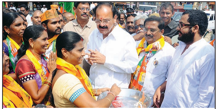
బీజేపీ నాయకులకు మంగళహారతులతో స్వాగతం పలుకుతున్న మహిళలు

దేశ గతి స్థితిని మార్చేది సరేంద్ర మోడీ నాయకత్వమేనని, అవినీతి కుంభ కోణాల ఊబిలో కూరుకుపోయిన దేశాన్ని రక్షించడానికి మనమంతా సరేంద్ర మోడీకి మద్దతు తెలపాలని బీజేపీ జాతీయ నాయకులు యం. వెంకయ్యనాయుడు పిలుపు నిచ్చారు. బుద్ధవారం బీజేపీ, తెలుగుదేశం అభ్యర్థులకు మద్దతుగా నెల్లూరులో జరిగిన రోడ్ షోలో ఆయన పాల్గొన్నారు. విఆర్ సి సెంటర్ వద్ద ప్రజలనుద్దేశించి ఆయన ప్రసంగించారు. అవినీతి అంతమైపోవా లంటే కేంద్రంలో ఎన్డీఎను, రాష్ట్రంలో తెలుగుదేశం, బీజేపీ కుటమిని గెలిపించాలన్నారు. రానున్న సార్వత్రిక ఎన్నికల్లో ఎన్డీఎ గెలవడం, మోడీ ప్రధాని కావడం, ఈ దేశ చరిత్ర మారడం ఖాయమన్నారు. నెల్లూరులో విద్యార్థిస్థాయి నాయకుడిగా జీవిస్తామి మొదలుపెట్టి ఈరోజు జాతీయ స్థాయి నాయకుడిగా ఎదిగానంటే అది నెల్లూరు నేల చలవేనన్నారు. గత ఎన్డీఎ ప్రభుత్వంలో జిల్లా నుండి ఒక్క బీజేపీ ప్రతినిధి లేకపోయినా 30 మంది కేంద్ర మంత్రులను తీసుకొచ్చి అభివృద్ధి పనులు చేయించానన్నారు. యూపీఎ ప్రభుత్వంలో