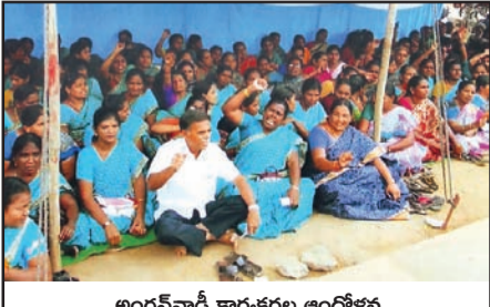
అంగన్వాడీ కార్యకర్తల ఆందోళన

సమస్యల పరిష్కారానికి పోరాడుతున్న అంగన్వాడీ కార్యకర్తలను ప్రభుత్వం పట్టించుకోవడం లేదని సిఐఐ డివిజన్ కార్యదర్శి కటికాల వెంకటేశ్వరు అన్నారు. సోమవారం అంగన్వాడీ సిబ్బంది గూడూరులో భారీర్యాలీ నిర్వహించి ఆందోళనలు చేశారు. కనీసం వేతనం రూ.10వేలు ఇవ్వాలని పింఛను సహా పదవీ విరమణ ప్రయోజనాలు వర్తింపజేయాలని అన్నారు. గూడూరు సబ్ కలెక్టర్ కార్యాలయం వద్దకు ర్యాలీగా వెళ్లి ఆ తరువాత ఆందోళనలు చేపట్టారు.