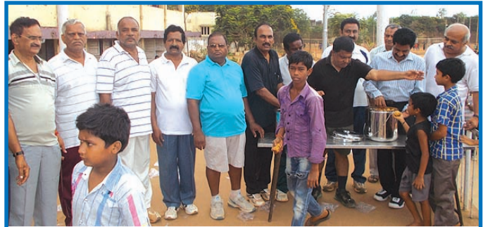
వేసవి సెలవుల సందర్భంగా నెల్లూరు ఏసి స్టేడియంలో చిన్నారులకు పాస్టికాహారం పంపిణీ చేస్తున్న ఏసి స్టేడియం వాకర్స్ అసోసియేషన్ సభ్యులు