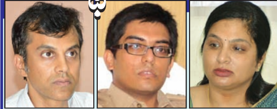
ఎన్నికలంటే రాజకీయపార్టీలకు చెలాటం... అభ్యర్థులకు ప్రతిష్టాత్మకం... అధికారులకు మాత్రం ప్రాణసంకటం. గెలుపు కోసం రాజకీయపార్టీల అభ్యర్థులు పోరాడుతారు.