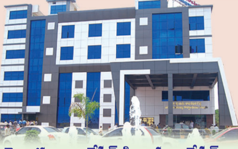
నెల్లూరు కార్పొరేషన్ డివిజన్ల లిజిస్ట్రేషన్లు

జిల్లాలో గూడూరు తప్పితే మిగిలిన అన్ని మున్సిపాలిటీలకు రిజర్వేషన్లు రావడంతో అన్ని పార్టీలు కూడా ఆయా వర్గాలకు చెందిన