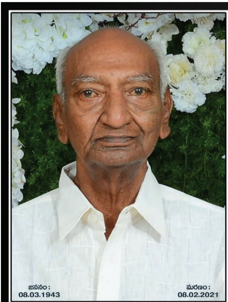
జననం: 08.03.1943 మరణం: 08.02.2021

కరోనా నివారణకు వేస్తున్న టీకాను రెండో డోసు వేసేందుకు జిల్లా వైద్యాధికారులు సిద్ధమవుతున్నారు. గతనెల 16న తొలివిడత టీకా వేయించుకున్నవారికి ఈనెల 13వతేదీతో 28రోజులు పూర్తవుతాయి కనుక రెండవ డోసు టీకా వేసేందుకు ఏర్పాట్లు చేస్తున్నారు. గతనెలలో టీకా ప్రారంభమైన రోజున 1346 మందికి టీకా వేశారు. ఆ తర్వాత వారం రోజుల్లో మరో 12,885 మందికి టీకా వేయడం జరిగింది. వారందరికీ ఇక రెండవ డోసు టీకా వేసేందుకు ఏర్పాట్లు జరుగుతున్నాయి. తొలి విడత టీకా పంపిణీకి పుణే ల్యాబ్ నుంచి 38,500 డోసుల కొవిషీల్డ్ వ్యాక్సిన్ వచ్చింది. అదే సంస్థ నుంచి జిల్లాకు మరో 30వేల డోసుల వ్యాక్సిన్ కూడా చేరిందని, ప్రతిఒక్కరూ టీకా వేయించుకోవాలని వైద్యులు సూచిస్తున్నారు.