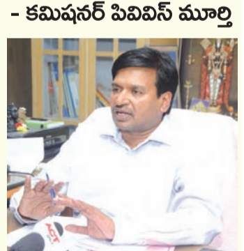
- కమిషనర్ పివివిస్ మూర్తి

కరోనా వైరస్ వ్యాప్తిని నివారించేందుకు తీసుకుంటున్న ముందస్తు చర్యల్లో భాగంగా నగరంలోని అన్ని మాంసపు దుకాణాలను ప్రతి ఆదివారం దినాల్లో మూసివేసేందుకు ఆదేశాలు జారీ చేసామని, మిగిలిన దినాల్లో భౌతిక దూరం పాటించకుండా విక్రయాలు జరిపే దుకాణాలపై భారీ జరిమానా విధించి, సరుకును జప్తు చేస్తామని నగర పాలక సంస్థ కమిషనర్ పివివిస్ మూర్తి హెచ్చరించారు. ఈ మేరకు సోమవారం ఒక పత్రికా ప్రకటనను ఆయన విడుదల చేశారు. ప్రజల మధ్య భౌతిక దూరం పాటించకుండా మాంసపు దుకాణాల్లో నిర్లక్ష్యంగా జరుగుతున్న విక్రయాలపై పెద్ద ఎత్తున ఫిర్యాదులు వచ్చాయని, జిల్లా కలెక్టర్ శేషగిరిబాబు సూచనల మేరకు పై ఆదేశాలను పటిష్టంగా అమలు చేస్తామని ఆయన స్పష్టం చేసారు.