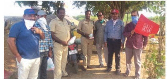
వాటర్ బాటిల్స్, జిస్కెట్లు అందజేస్తున్న ఎల్ఐసి సిబ్బంది