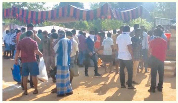
చాపల అంగడి ముందు గుంపులుగా గుమ్మగూడిన జనం

కరోనా వైరస్ నేపథ్యంలో ప్రజలంతా సోమవారం నుండి శనివారం దాకా లాక్డౌన్ నిబంధనలను విధిగా పాటిస్తున్నారు. కూరగాయల మార్కెట్ వద్దకుపోతే క్యూలో నిలబడి భౌతిక దూరం పాటిస్తున్నారు. ముఖాలకు మాస్కులు తగిలిస్తున్నారు. గంటకోసారి చేతులకు శానిటైజర్లు పూస్తున్నారు. ప్రావిజన్ షాపుల వద్దకు వెళ్లినా పద్ధతిగా కొనుగోలు చేస్తున్నారు. ప్రధాని నరేంద్ర మోడీ