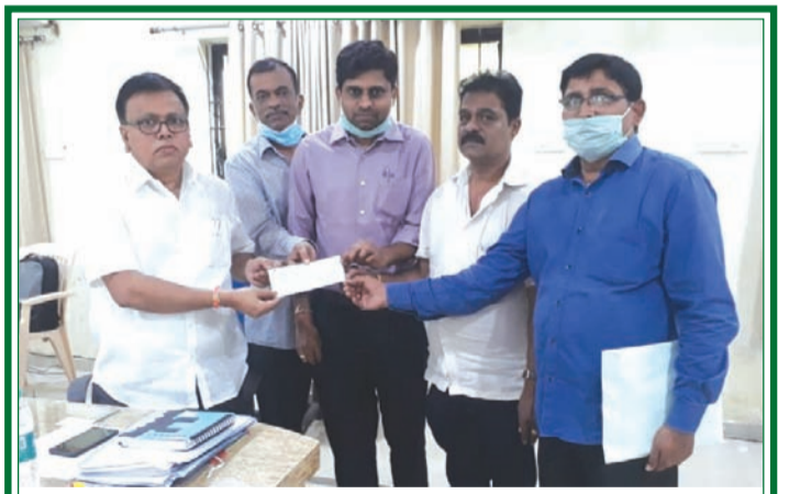
నెల్లూరుజిల్లాలో కరోనా నియంత్రణ చర్యల కోసం తమవంతు సహాయంగా ఇటీవల డిఆర్ డిఓ మల్లిఖార్జునరావును కలిసి 4.10లక్షల విరాళం చెక్కున అందజేస్తున్న ఇండియన్ ఆయిల్ కార్పొరేషన్ పెట్రోల్ పంపు డీలర్స్ అసోసియేషన్ సభ్యులు