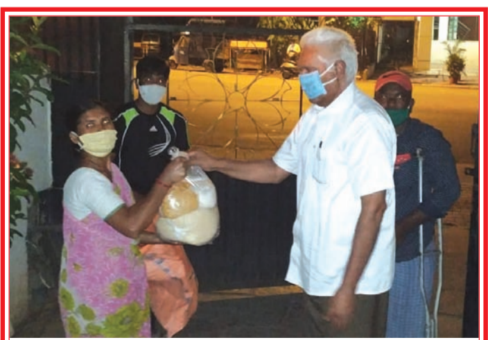
కర్షక కరోనా ప్రభావంతో ఆకలితో అలమటిస్తున్న 200 కుటుంబాల వారికి బెంగుళూరులోని తన ఇంటి వద్ద ఉచితంగా రేషన్ పంపిణీ చేస్తున్న ప్రముఖ దాత జెఎన్ రెడ్డి.