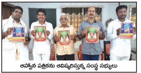
ఆహ్వాన పత్రికను ఆవిష్కరిస్తున్న సంస్థ సభ్యులు

తిరుమల తిరుపతి దేవస్థానములు, హిందూ ధర్మ ప్రచార పరిషత్, శ్రీ వేంకటేశ్వర కల్యాణ మహోత్సవ కమిటీ సంయుక్త ఆధ్వర్యంలో ఈనెల 22వతేదీ ఆదివారం ఉదయం 9గం