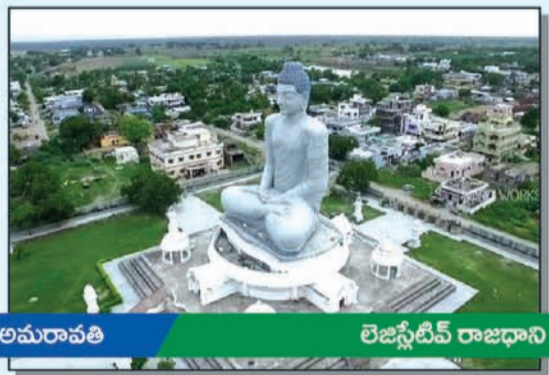
అమరావతి లెజిస్లేటివ్ రాజధాని