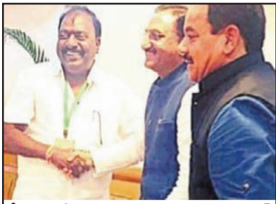
కేంద్రమంత్రికి కృతజ్ఞతలు తెలుపుతున్న బల్లి దుర్గాప్రసాద్

నెల్లూరుజిల్లా పెళ్ళకూరు మండలంలోని పాలచూరు గ్రామంలో, చిత్తూరుజిల్లా నారాయణవనం మండలంలోని కైలాసకోనల్లోనూ వచ్చే విద్యాసంవత్సరం నుంచి కేంద్రీయ విద్యాలయాలు ప్రారంభమవుతాయని తిరుపతి ఎంపీ బల్లి దుర్గాప్రసాద్ రావు వెల్లడించారు. తిరుపతి పార్లమెంట్ పరిధిలో ఈ రెండు కేంద్రీయ విద్యాలయాలు మంజూరు చేసినందుకు ఆయన ఈనెల 13న కేంద్ర మానవవనరుల శాఖ మంత్రిని కలిసి కృతజ్ఞతలు చెప్పారు. రాష్ట్ర ముఖ్యమంత్రి వైఎస్ జగన్మోహన్ రెడ్డి సారధ్యంలో తిరుపతి పార్లమెంట్ పరిధిలోని అన్ని నియోజకవర్గాల్లో పలు అభివృద్ధిపనులను సంబంధిత కేంద్రమంత్రుల దృష్టికి తీసుకువెళ్ళి మంజూరుకు కృషి చేస్తున్నారని ఆయన వివరించారు.