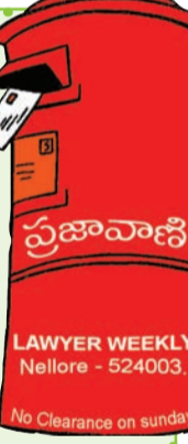
- బాధితులు, నెల్లూరు.

ఈ తరం పిల్లల ఆలోచనలు ప్రమాదకరంగా వుంటున్నాయి. నెల్లూరు నగరంలోనే నివాసిత ప్రాంత వీధులలో క్రికెట్, ఫుట్ బాల్, కాట్ బాల్ ఆడుతూ గృహస్థులకు ఇబ్బంది కలిగిస్తున్నారు. ఇదేమని ప్రశ్నించిన వారిపై దౌర్జన్యానికి దిగుతున్నారు. కొన్ని వీధులలో యువకులు బ్యాచ్ లుగా ఏర్పడి అల్లరి చేస్తున్నారు. వీరివల్ల వీధుల్లో వెళ్ళే వాహన దారులు, పాదచారులకు చాలా ఇబ్బందిగా వుంటోంది. పోలీసులు ఇలాంటివారిపై దృష్టి సారించాలి. వారి ఆగడాలను నియంత్రించాలి.