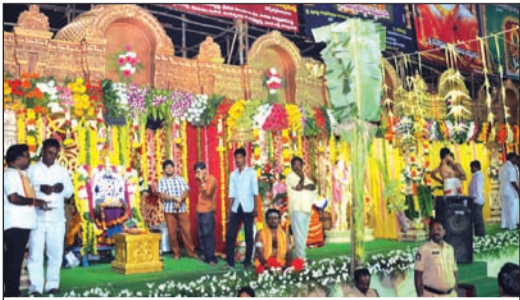
పెన్నాతీరంలో కొలువైన వివిధ దేవతామూర్తులు

సంక్రాంతి పండుగ ముగింపు వేడుకల్లో భాగంగా ఈ నెల 17వ తేదీ రాత్రి పెన్నాతీరం పరవశించింది. గొబ్బెమ్మ ఓల లాడింపు వేడుకకు భక్తులు వేలాదిగా తరలివచ్చారు. సంక్రాంతి సందర్భంగా గొబ్బె గౌరవుకు విశేషంగా పూజలు నిర్వహించి పెన్నా నదిలో నిమజ్జనం చేసేందుకు విచ్చేసిన భక్తులతో పెన్నాతీరం కిటకిటలాడింది. వేడుక అనంతరం భక్తులు కుటుంబ సమేతంగా పెన్నాతీరంలో ఆహారపరంపరలో గాలిపటాలను ఎగుర వేస్తూ సందడి చేశారు. విద్యుద్దీప కాంతుల నడుమ పెన్నాతీరం సూతన శోభతో కళకళలాడింది. రంగనాయకులపేట నుంచి శ్రీదేవి భూదేవి సమేత శ్రీ రంగనాథుడు, జొన్నవాడ కామాక్షమ్మ,