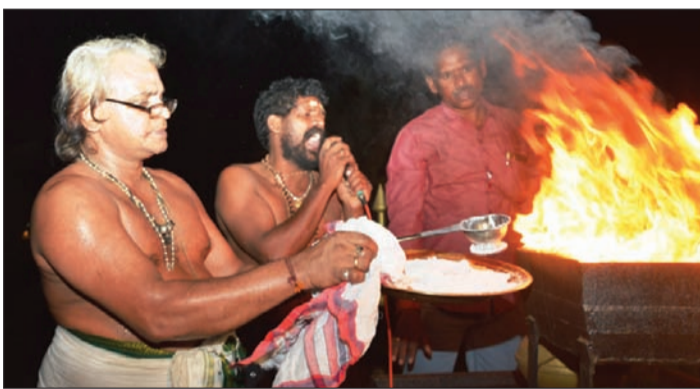
మకర జ్యోతిని వెలిగిస్తున్న అర్చకులు