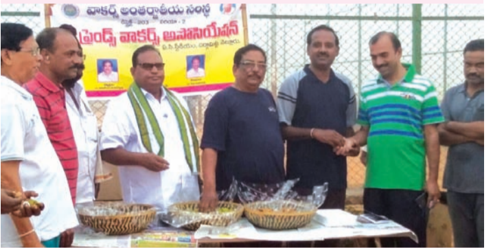
సంక్రాంతి పిండివంటలు పంచి పెడుతున్న ఫ్రెండ్స్ వాకర్స్ అసోసియేషన్ సభ్యులు