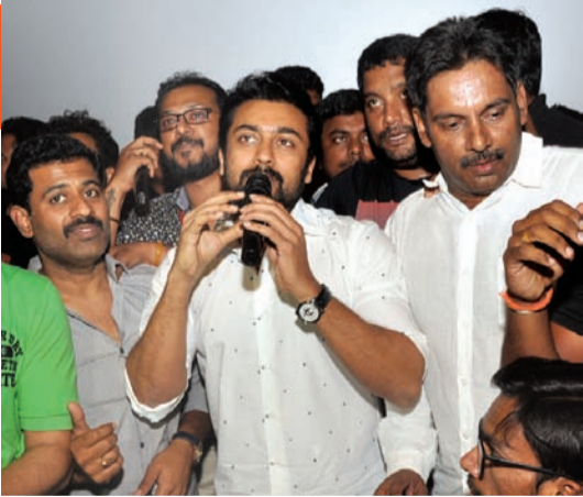
అభిమానులను ఢిల్లీంచి మాట్లాడుతున్న హీరో సూర్య

సింగం ఫేమ్ తమిళనాడు సూర్య 'గ్యాంగ్' చిత్రం విజయోత్సవ యాత్రలో భాగంగా 16వ తేదీ నెల్లూరుకు వచ్చారు. యం.జి. మాలలో 'గ్యాంగ్' సినిమా ప్రదర్శిస్తున్న స్క్రీన్ లోకి వెళ్ళి సూర్య, ఈ చిత్ర బృందం ప్రేక్షకులను పలుకరించింది. సూర్య వస్తున్నాడనే సమాచారంతో అభిమానులు పెద్దఎత్తున యం.జి. మాలకు చేరుకున్నారు. మాలలోకి రాగానే సూర్య ప్రేక్షకులకు అభివాదం చేస్తూ థియేటర్ లోకి వెళ్ళారు. ఈ సందర్భంగా ఏర్పాటు చేసిన విలేకరుల సమావేశంలో సూర్య మాట్లాడుతూ నెల్లూరుంటే తనకెంతో ఇష్టమని, ఇక్కడికి రావాలంటే ఎంతో ఆనందంగా ఉంటుందని చెప్పారు. 'గ్యాంగ్' చిత్రాన్ని విజయవంతం చేసిన నెల్లూరు ప్రేక్షకులకు ఆయన ధన్యవాదాలు తెలిపారు. 'గ్యాంగ్' చిత్రాన్ని అన్ని వర్గాల ప్రజలు, అన్ని ప్రాంతాల ప్రజలు ఆదరిస్తున్నారని, నెల్లూరులో హాస్పిటల్ కలెక్షన్ లతో ఈ సినిమా ఆదతుండడం సంతోషంగా వుందన్నారు. ఏడాది క్రితం