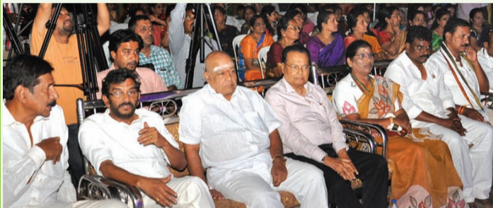
కార్యక్రమంలో పాల్గొన్న ముఖ్యఅతిథులు