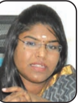
శిక్షణా కార్యక్రమం నిర్వహించారు. కౌంటింగ్ సందర్భంగా తీసుకోవాల్సిన చర్యల గురించి వివరించారు.