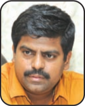
శిక్షణా కార్యక్రమం నిర్వహించారు. కౌంటింగ్ సందర్భంగా తీసుకోవాల్సిన చర్యల గురించి వివరించారు.