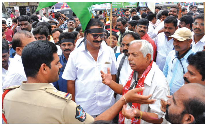
పోలీసులతో వాగ్వాదానికి దిగిన అఖిలపక్ష నాయకులు