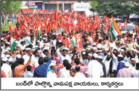
బంద్లో పాల్గొన్న వామపక్ష నాయకులు, కార్యకర్తలు

కేంద్ర ప్రభుత్వం ప్రజా వ్యతిరేక విధానాలను అవలంబిస్తుందని ఆరోపిస్తూ ఈనెల 8 న అఖిలపక్షం ఆధ్వర్యంలో చేపట్టిన భారత్ బంద్ నెల్లూరు జిల్లాలో విజయవంతమైంది. వామపక్ష పార్టీలు, కార్మిక సంఘాల ఆధ్వర్యంలో ఊరూరా నిరసనలబాట పట్టిన ఆందోళనకారులు ఎక్కడిక్కడ రహదారులు దిగ్బంధించి దుకాణాలను, పాఠశాలలను మూయించారు. ప్రధానంగా జిల్లాకేంద్రమైన నెల్లూరు, నెల్లూరు రూరల్ ప్రాంతాల్లో బంద్ ప్రభావం ఎక్కువగా కనిపించింది. వామపక్ష పార్టీలు, కార్మిక సంఘ నాయకులు నెల్లూరు ఆర్డీసీ బస్టాండు నుంచి వీఆర్సీ సెంటర్ వరకు నిరసన ప్రదర్శనలు చేపట్టారు. అత్యున్నత బస్టాండు నుంచి వీఆర్సీ సెంటర్ వరకు ర్యాలీ నిర్వహించారు. వీరికి మద్దతుగా కాంగ్రెస్, ముస్లిం మైనారిటీ నాయకులు నిలిచారు. ఆందోళనకారులు జాతీయజెండాలు చేతపట్టి ఎన్ఆర్సీ, సీఏఏ లకు వ్యతిరేకంగా నినాదాలు చేశారు. కొంతమంది నల్ల రిబ్బన్లు ధరించి ద్వీచక్రవాహనాలపై నగరవీధుల్లో తిరుగుతూ అత్యున్నత బస్టాండు నుంచి స్టోప్వౌస్ మీదుగా నవాబుపేట వరకు దుకాణాలు మూత వేయించారు. జాతీయ రహదారిని కొంతసేపు నిర్బంధించి వాహనాల రాకపోకలను అడ్డుకున్నారు. అన్ని నియోజకవర్గాల్లో బంద్ ప్రశాంతంగా జరిగింది.