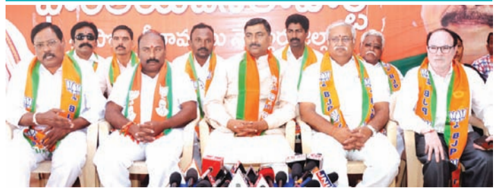
విలేకర్ల సమావేశంలో మాట్లాడుతున్న మురళీధర్ రావు

- బీజేపీ జాతీయ ప్రధానకార్యదర్శి మురళీధర్ రావు