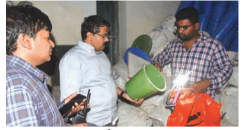
కార్పొరేషన్ గోడౌన్ ను తనిఖీ చేస్తున్న జిల్లా కలెక్టర్ శేషగిరిబాబు

విధి నిర్వహణలో అలసత్వం పనికిరాదని, కార్పొరేషన్లో పారిశుధ్య సామగ్రి నిల్వచేసే గోడౌన్లో ఏ వస్తువు ఎక్కడుంట్లో స్పష్టత లేదని, సంబంధిత అధికారుల పర్యవేక్షణ కొరవడింది, మరీ ఇంత నిర్లక్ష్యమా అంటూ నగరపాలక సంస్థ సిబ్బందిపై జిల్లా కలెక్టర్ ఎంపి శేషగిరిబాబు మండిపడ్డారు. గోడౌన్ ను నిర్వహిస్తున్న ఉద్యోగులపై వెంటనే చర్యలు తీసుకోవాలని ఆదేశించారు. ఈనెల 7న పాత మునిసిపల్ కార్యాలయం ప్రాంగణంలో పారిశుధ్య సామగ్రిని నిల్వచేసే గోడౌన్ కలెక్టర్ పరిశీలించారు. ఈ గోడౌన్ నిర్వహణ సరిగా లేదని, సంబంధిత ఉద్యోగులపై చర్యలు తీసుకోవాలని, గోడౌన్లో వస్తువులకు లెక్కచెప్పాలని అధికారులను కలెక్టర్ ఆదేశించారు. సిబ్బంది తీరు మారకుంటే కఠినచర్యలు తప్పవని హెచ్చరించారు.