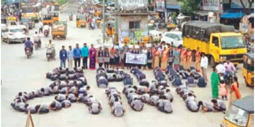
'సేవ్ గర్ల్స్' ఆకారంలో కూర్చుని నినాదాలు చేస్తున్న విద్యార్థినులు