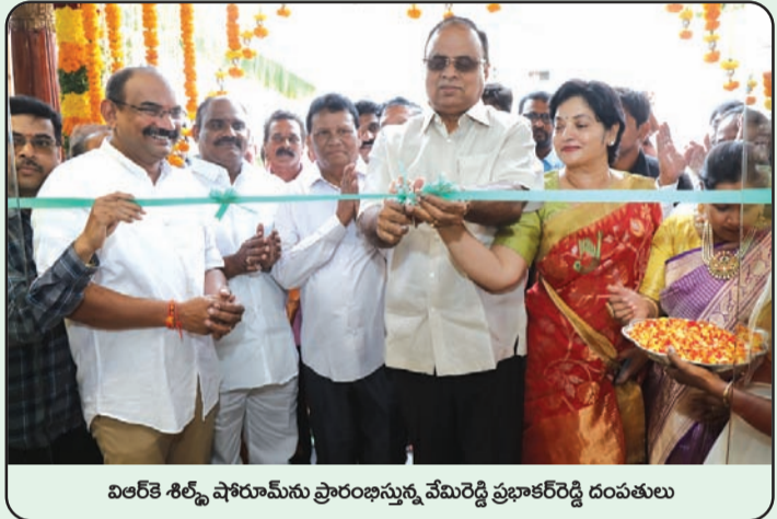
విఆర్కె శిల్పి షోరూమ్ ను ప్రారంభిస్తున్న వేమిరెడ్డి ప్రభాకర్ రెడ్డి దంపతులు