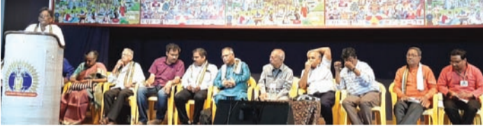
సమావేశంలో ప్రసంగిస్తున్న సర్వేపల్లి రామమూర్తి