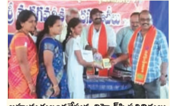
బహుమతులందజేస్తున్న విహెచ్పి ప్రతినిధులు