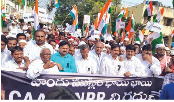
ర్యాలీలో పాల్గొన్న ముస్లిం సోదరులు